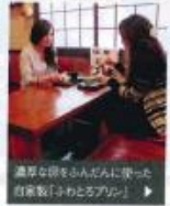
濃厚な味をらんだんに家一と 自家製「ふわとろプリン」